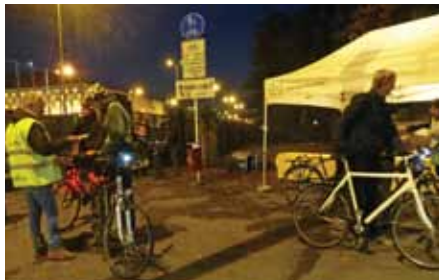
Kontrolliert wurden die Fahrräder von den Freiwilligen der LVI.

Nach einem kurzen Licht- und Reflektorencheck durch die Freiwilligen der LVI bekam jeder Radfahrer eine Kopie seiner Mängelliste mit. Kleinere Reparaturen konnten sofort vor Ort getätigt werden durch die Mitarbeiter des Velo Sport Center. Glühbirnen wurden ausgetauscht, Leitungen und Kontakte