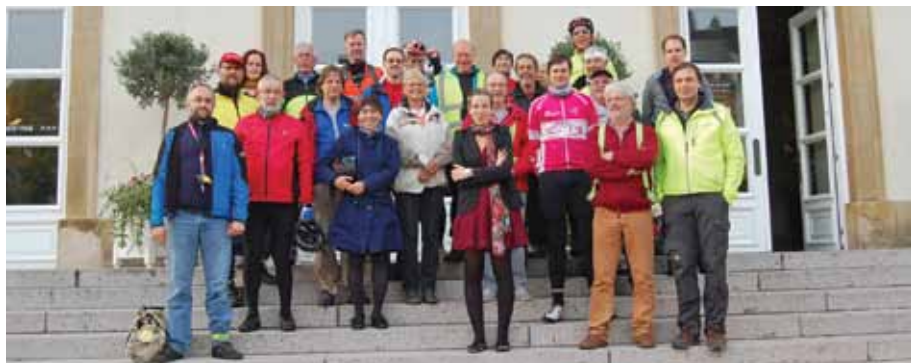
Accueil des cyclistes à la mairie de Luxembourg-Ville.

Depuis lors, les communes de la Convention ont en effet entrepris certains efforts en la matière, avec notamment la construction du tronçon manquant de la PC15 entre Lorentzweiler et Lintgen, mais également par des améliorations de l'infrastructure cyclable existante tels l'élimination d'obstacles divers (poteaux, mise à zéro des bordures de trottoir, taille de haies etc.) ou encore l'installation d'un éclairage de la PC15 à Steinsel et la réparation du revêtement sur