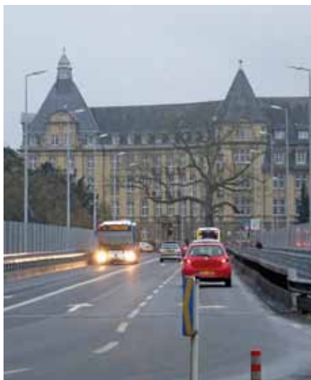
Pont Adolphe - Noch immer kein Platz für Radfahrer!