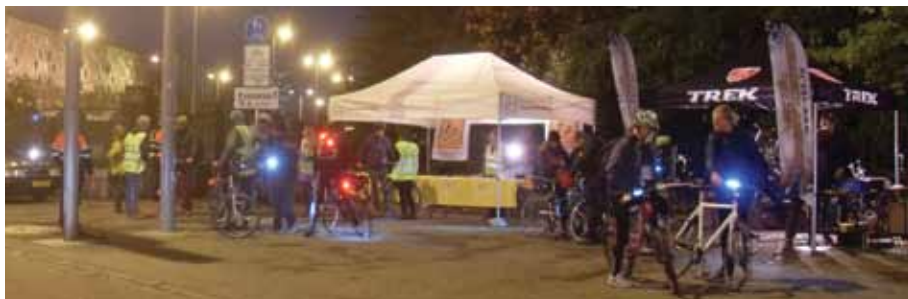
Mehr als 70 Fahrräder wurden geprüft.

Nachts und bei schlechtem Wetter muss die Lichtanlage komplett sein.